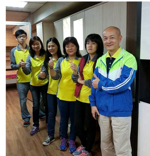
圖 3. 家王室內團隊合照

輕量化石材薄板、石材薄板製程與玻璃膠合技術、生活櫥櫃整合設計三方領域，開發透光複合石材薄板應用於生活櫥櫃產品，可提升櫥櫃、石材、玻璃產業之技術能量，引領傳統的建材產業跨足室內裝修產業與櫥具系統產業，達到市場區隔與差異化的策略，開拓更多可能的市場性，帶動多元化的異材質整合的應用商機，提高相關產業的競爭力。